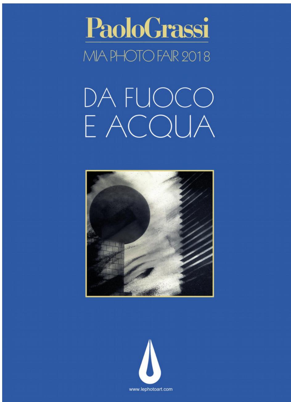
Illustrazione 1: Copertina del Catalogo – MIA Photo fair 2018. Da fuoco e acqua

La fiera internazionale dedicata alla fotografia d'arte ospita quest'anno il progetto originale di Paolo Grassi , che nella rielaborazione degli elementi archetipici della nostra cultura esprime la propria vena creativa.