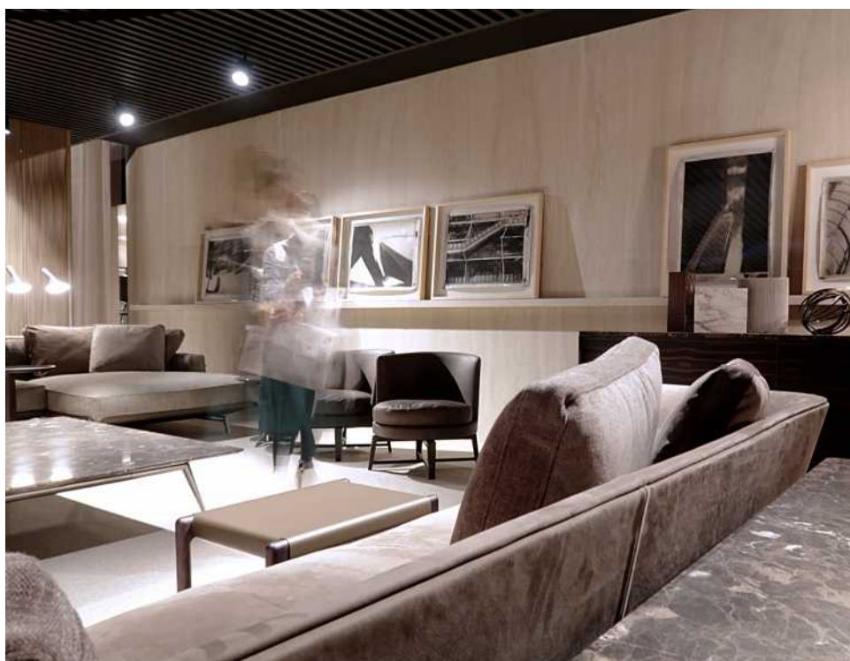
Immagini dell'esposizione.